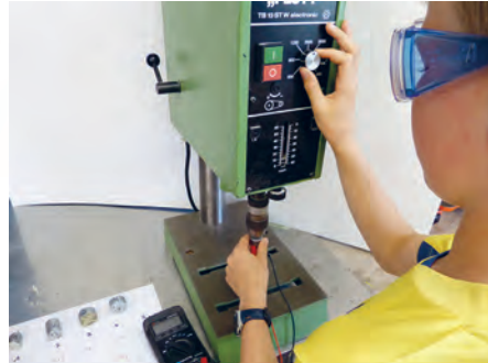
Wie viel Spannung wird erzeugt?