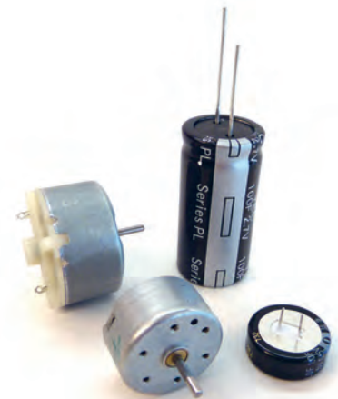
Solarmotoren und Kondensatoren