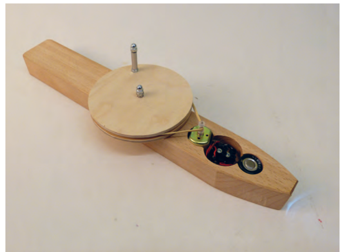
Übersetzung des Handantriebs über eine Riemenscheibe – links die Lampe ohne Gehäuse, rechts verpackt im massiven Buchengehäuse.